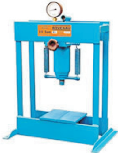
Modelos P 10000